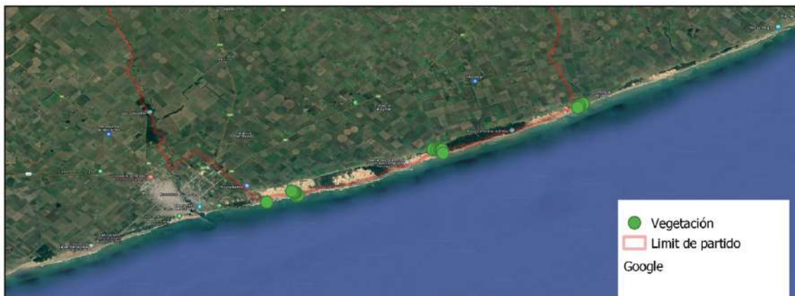
Fig. 2. Distribución de muestras de flora colectadas en el sector costero del partido de Lobería.