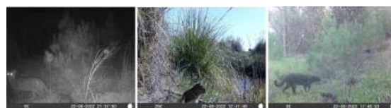
Fig. 12. Ejemplos de registros de mamíferos mediante cámaras trampa. Se muestran registros diurnos y nocturnos para el gato montés, peludo y liebre europea.

al menos 120 especies de vegetales, más de 76 especies de invertebrados bentónicos y macroalgas en los intermareales rocosos del sector estudiado, 2 especies de anfibios, 4 especies de reptiles, 101 especies de aves y 15 especies de mamíferos.