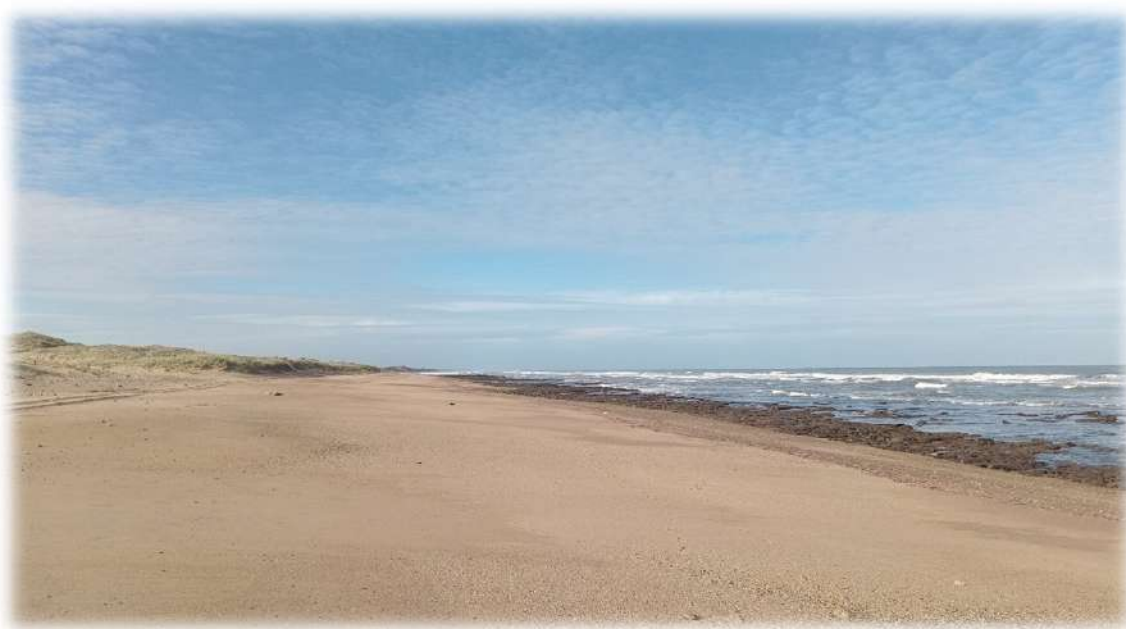
Fig. 9. Playas arenosas e intermareales rocosos en la costa del partido de Lobería.