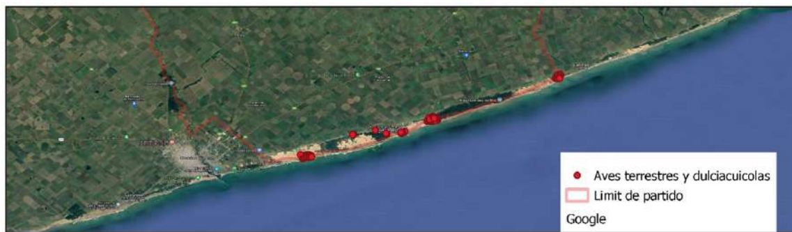
Fig. 5. Distribución de muestras de aves terrestres y dulceacuícolas colectadas durante la campaña de invierno en el sector costero del partido de Lobería.