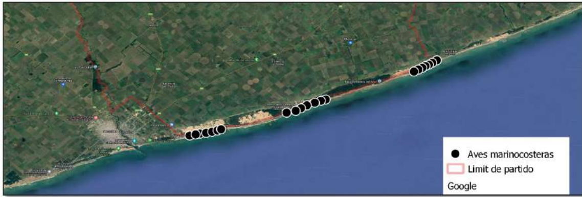
Fig. 6. Distribución de muestras de aves marino-costeras colectadas durante la campaña de invierno en el sector costero del partido de Lobería.

Para relevar la información necesaria, se administró anestesia inhalatoria (isoflurano) a cada individuo capturado de manera de minimizar el estrés durante su manipulación. Los individuos recuperaron su estado de alerta aproximadamente 3 minutos después de suspender la anestesia inhalatoria. Mientras estaban anestesiados, se determinó su especie, sexo, clase de edad, peso y se tomaron medidas morfométricas de longitud del cuerpo, cola, pata y oreja. También se tomaron fotografías dorsales y laterales de cada individuo. Además, se marcó cada individuo con una pequeña marca de pintura en la oreja para evitar duplicar el registro en caso de que fueran recapturados en los días siguientes.