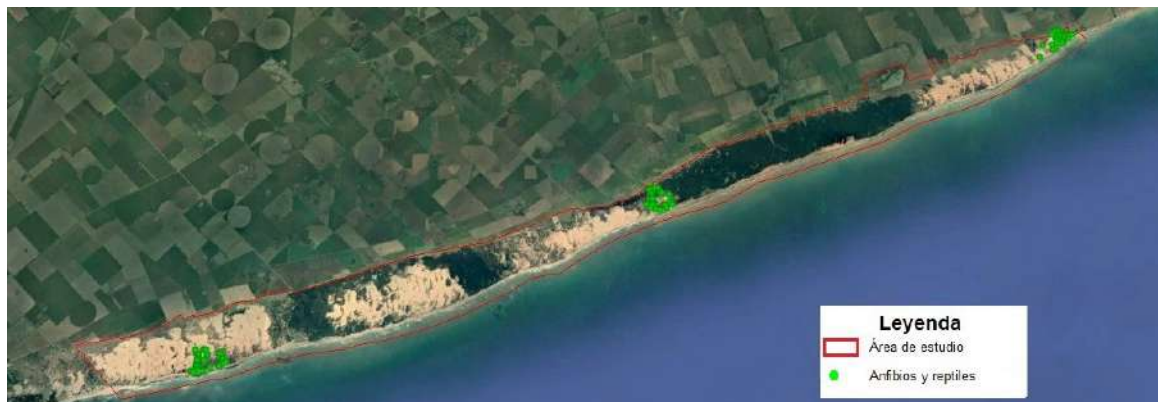
Fig. 4. Distribución de las transectas de registro de anfibios y reptiles en los diferentes ambientes del sector costero del partido de Lobería.