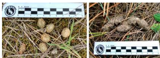
Fig. 10. Ejemplos de registros de rastros de mamíferos. Izquierda heces de liebre, derecha, de gato montés.

Durante los foto-trampeos, se detectaron 7 especies de mamíferos: la liebre europea ( Lepus europeus ) fue la especie con más registros, tanto en el pastizal como en el bosque. También el peludo ( Chaetophractus villosus ) y el gato montés ( Leopardus geoffroyi ) fueron abundantes en ambos hábitats. Con menor frecuencia, se registraron zorrinos ( Conepatus chinga ), zorros gris pampeano ( Lycalopex gymnocercus ), ratones hocicudos ( Oxymycterus rufus ) y la rata europea ( Ratus ratus ). Debido a que la mayoría de las especies registradas utilizan grandes áreas de acción, estas hicieron un uso del mosaico total de los hábitats en el paisaje, aunque sus registros fueron más frecuentes en el pastizal. Ver Fig. 12 y Tabla 9 para más detalles.