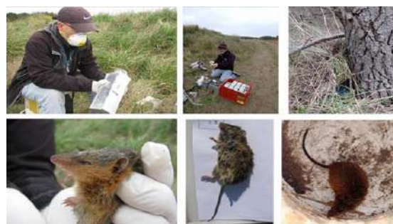
Fig. 11. Colocación de trampas Sherman en muestreos de pequeños mamíferos. En la serie inferior, de izquierda a derecha: Monodelphis dimidiata , Akodon azarae , Oxymycterus rufus .

Del trabajo de campo realizado entre agosto de 2022 y mayo de 2023 en el sector costero del partido de Lobería se registraron