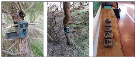
Fig. 8. Puesta a punto de las cámaras trampa en el área de estudio.