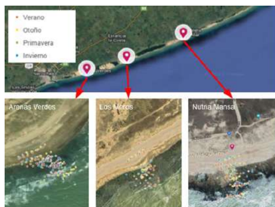
Fig. 3. Mapa mostrando la ubicación general de los tres sitios de muestreo y detalle de los puntos en los que se tomaron las muestras. Los distintos colores corresponden a la estación del año en la que se tomó cada muestra representada en el mapa.

mediante la extracción de la tosca en la misma área del cuadrado de 15 X 15 del paso anterior y hasta una profundidad de 5 cm.