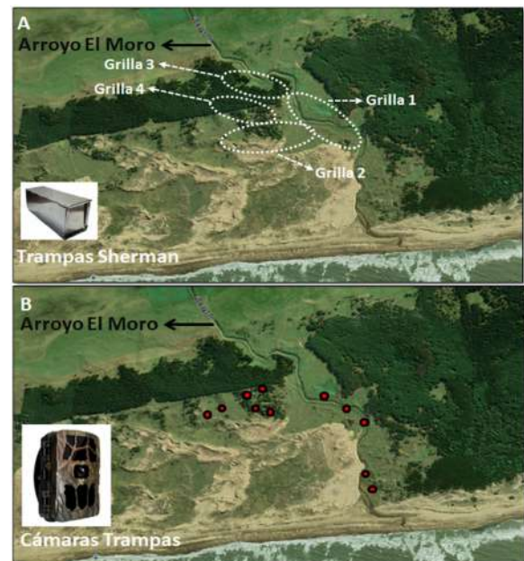
Fig. 7. Áreas de disposición de transecta de trampas Sherman (A) y cámaras trampa (B) en cada uno de los ambientes descritos.

frente del dispositivo (Fig. 8). Con el fin de evitar activaciones innecesarias, se evitó la exposición directa al sol y se procuró reducir el movimiento de la vegetación circundante, cuidando de alterar el entorno lo menos posible. La distancia entre cámaras en un mismo ambiente fue de al menos 100 m, y cada cámara fue cebadas en su área de acción con atún, carne vacuna y pollo para atraer a una amplia gama de especies de mamíferos carnívoros y carroñeros presentes en el área. Las cámaras se configuraron para capturar 3 fotos por evento (y, si el modelo lo permitía, grabar videos de 10 segundos), con un intervalo de 15 segundos entre cada evento, utilizando una sensibilidad de PIR normal. Con el objetivo de evitar la superposición de datos, se estableció un intervalo de 30 minutos entre los registros (independencia de eventos). Se registraron las ubicaciones de las cámaras trampa utilizando GPS.